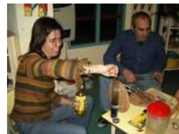
Armando el tubo de inmiscibilidad. La inclusión de los padres en las actividades refuerza la confianza en la institución educativa.