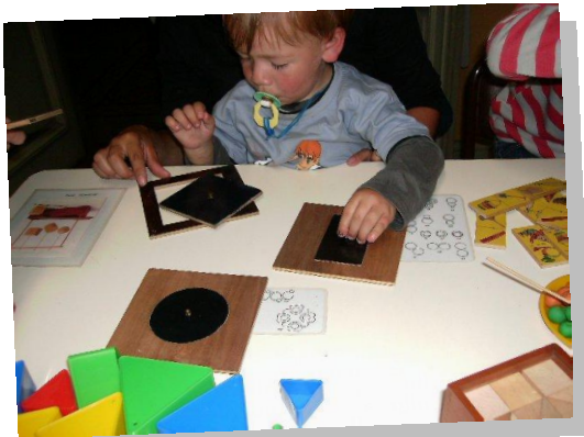
Fig. 2 – Material montessoriano