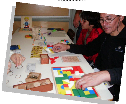
Fig. 3- Juego de construcción basado en material froebeliano