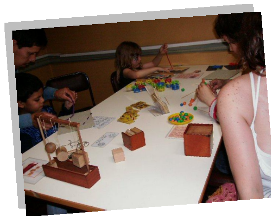
Fig. 1- Dones 1, 3 y 5 del material froebeliano.