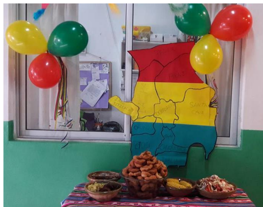
Comidas típicas realizadas por mamás de la comunidad boliviana