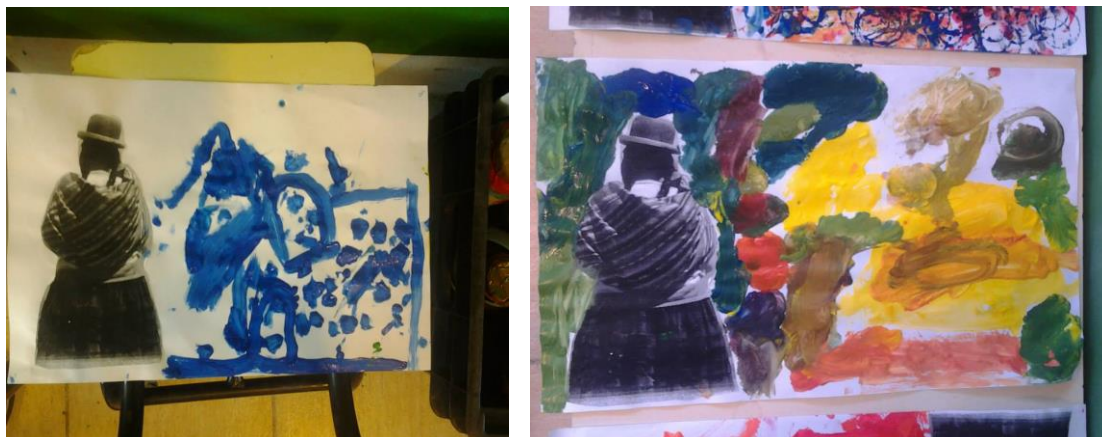
Producciones de artes visuales

Carta dictada por los/as niños/as para agradecer la visita