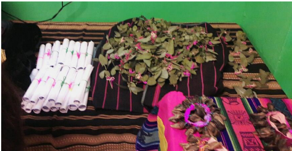
Mesas con eucalipto y frases realizadas por una mamá de la sala, para regalar a los/as invitados/as