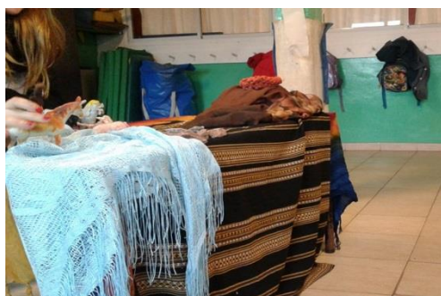
Narración de cuentos de mesa contando la historia de la danza del tinku